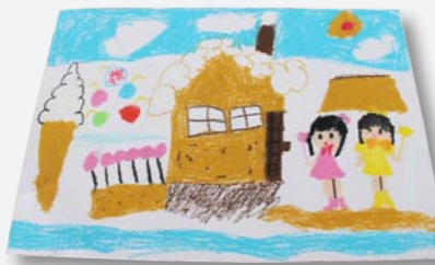
↑「わたしのゆめ(おかしのにへいく)」