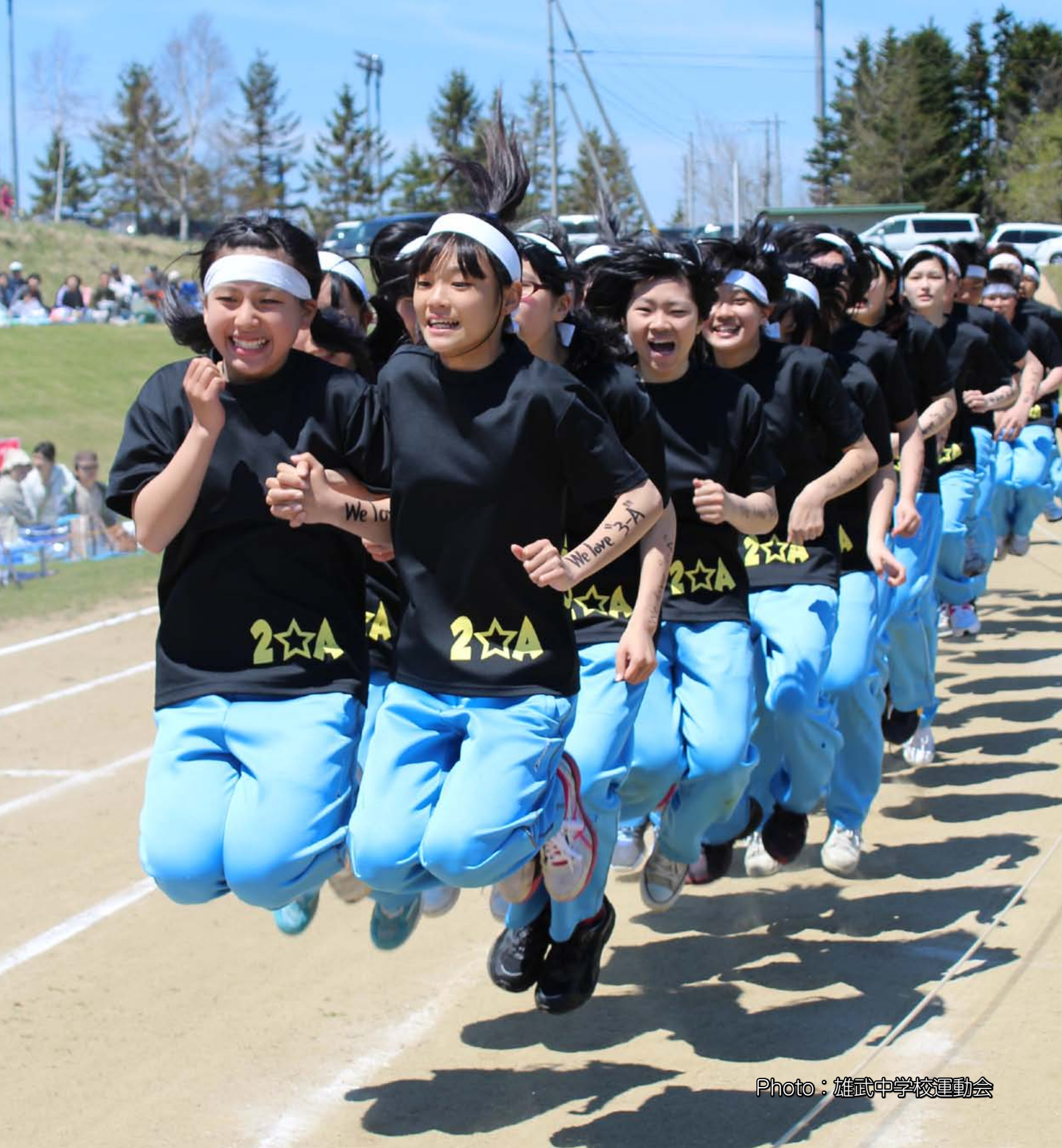
Photo : 雄武中学校運動会